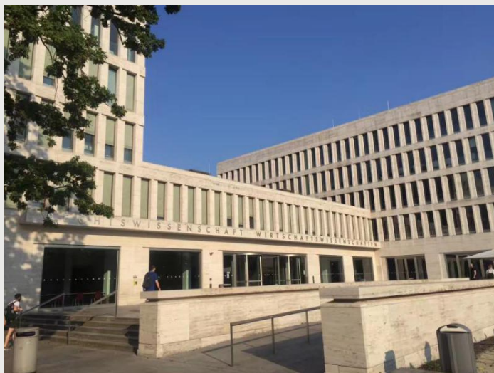
德国法兰克福大学图书馆