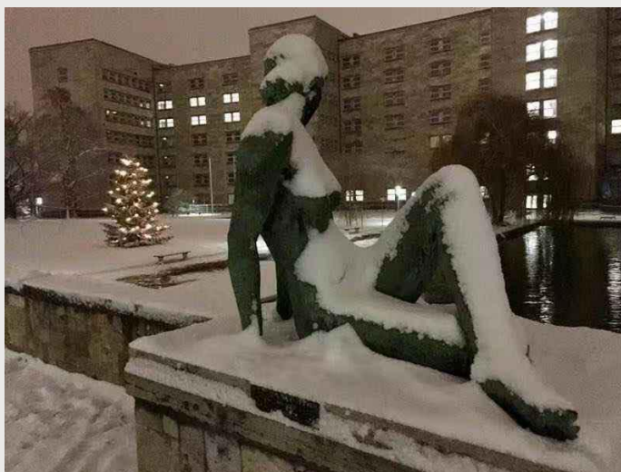
德国法兰克福大学校园雕塑

对于学生而言，查阅数据库也有助于避免借不到书的情况——数据库没有访问人数限制。当然，图书馆还是会不断购买新版经典教科书，且往往一次购买几十本，毕竟很多学生还是喜欢阅读纸质书。笔者对电子书起初是“厌恶”的，后来便不再抗拒。笔者有晚上不读法学专业书的“陋习”。旅居德国，难以获得中文纸质书籍，就通过阅读 Kindle 电子书的方式解腹内书虫之渴。初时也多觉不便，待读得多了，也并无不适之感。