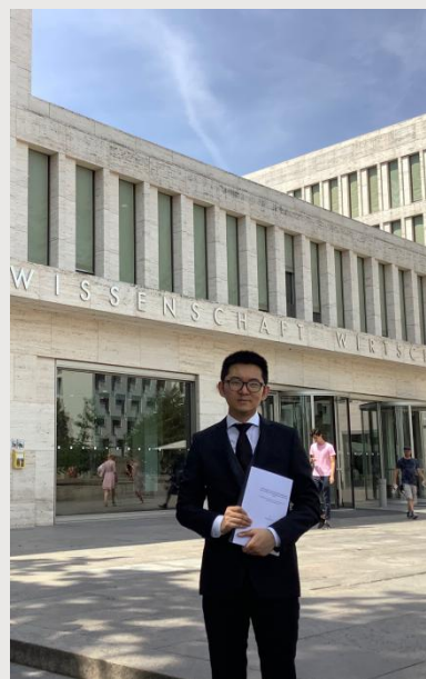
作者留学期间校园留影

法兰克福大学的图书馆藏书极为丰富，除了大量的专著之类，笔者希望介绍一下图书馆的教科书、案例书以及杂志情况。教科书是法律教育和法学研究的基础图书。德国教科书的编写体系往往不拘泥于法律文本的章节顺序，而是加入了法律