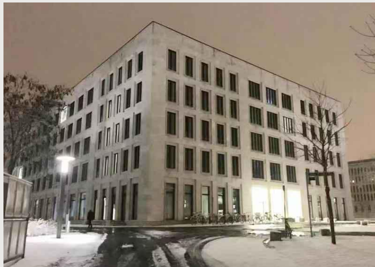
德国法兰克福大学教学楼

Gesetzbuch), 历经数十年修订, 每卷仅包括少数条文, 总卷数达 96 卷。法兰克福大学图书馆也购买了几套法律评论。但如果要满足学生需要, 就必须购买数据库, 以此确保学生能够不受书册数量的桎梏。更何况, 法律评论经常更新, 数据库有助于学生了解最新的观点变化。德国 Beckonline 数据库收录了《慕尼黑法律评论》, 并全部提供下载和打印, 是法学学生几乎每天必上的网站。与之遥相呼应的是 Juris 数据库。Juris 是德国司法部于 1984 年开始着手建立的一家专业的网上判决数据库, 它的文档中心就坐落在法院里, 收录了超过 100 万篇德国法院判决。